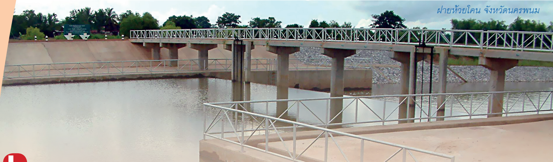
ฝายห้วยโคน จังหวัดนครพนม

เนื่องในโอกาสวันคล้ายวันพระราชสมภพในสมเด็จพระบรมโอรสาธิราชฯ สยามมกุฎราชกุมาร วันที่ ๒๔ กรกฎาคม ๒๕๕๗ ข้าราชการและเจ้าหน้าที่ สำนักงาน กปร. ขอถวายพระพรให้ทรงมีพระชนมายุยืนยืนาน ซึ่ง สำนักงาน กปร. ได้สนองงานพระราชดำริในสมเด็จพระบรมโอรสาธิราชฯ สยามมกุฎราชกุมาร ในงานด้านต่างๆ โดยเฉพาะโครงการพัฒนาแหล่งน้ำ และการพัฒนาอาชีพเกษตรกรที่พระราชทานความช่วยเหลือ สนับสนุนเกษตรกรในพื้นที่ต่างๆ ให้สามารถประกอบอาชีพเพื่อเลี้ยงตนเองและมีความรู้ในการพัฒนาอาชีพของตนได้อย่างมั่นคง มีคุณภาพชีวิตที่ดีขึ้น